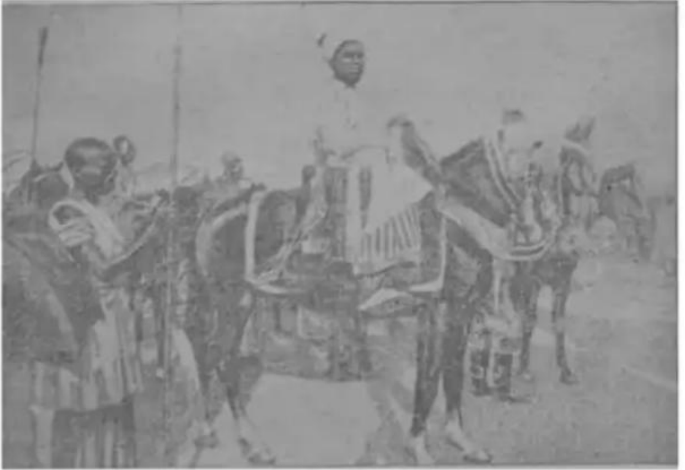
رابع الامبراطور في عاصمة مملكته دكوة

في تلك المدينة المزدهرة جنبا إلى جنب بملابسهم المختلفة وعاداتهم المتباينة .